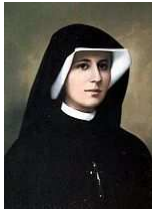
Sainte Faustine Kowalska

Cette série de prières catholiques est généralement priée sur les grains d'un chapelet catholique marial ordinaire. Le Je vous salue Marie et le Notre Père des dizaines sont remplacés par des prières spécifiques.